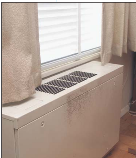
Moho creciendo sobre la superficie de un ventilador.